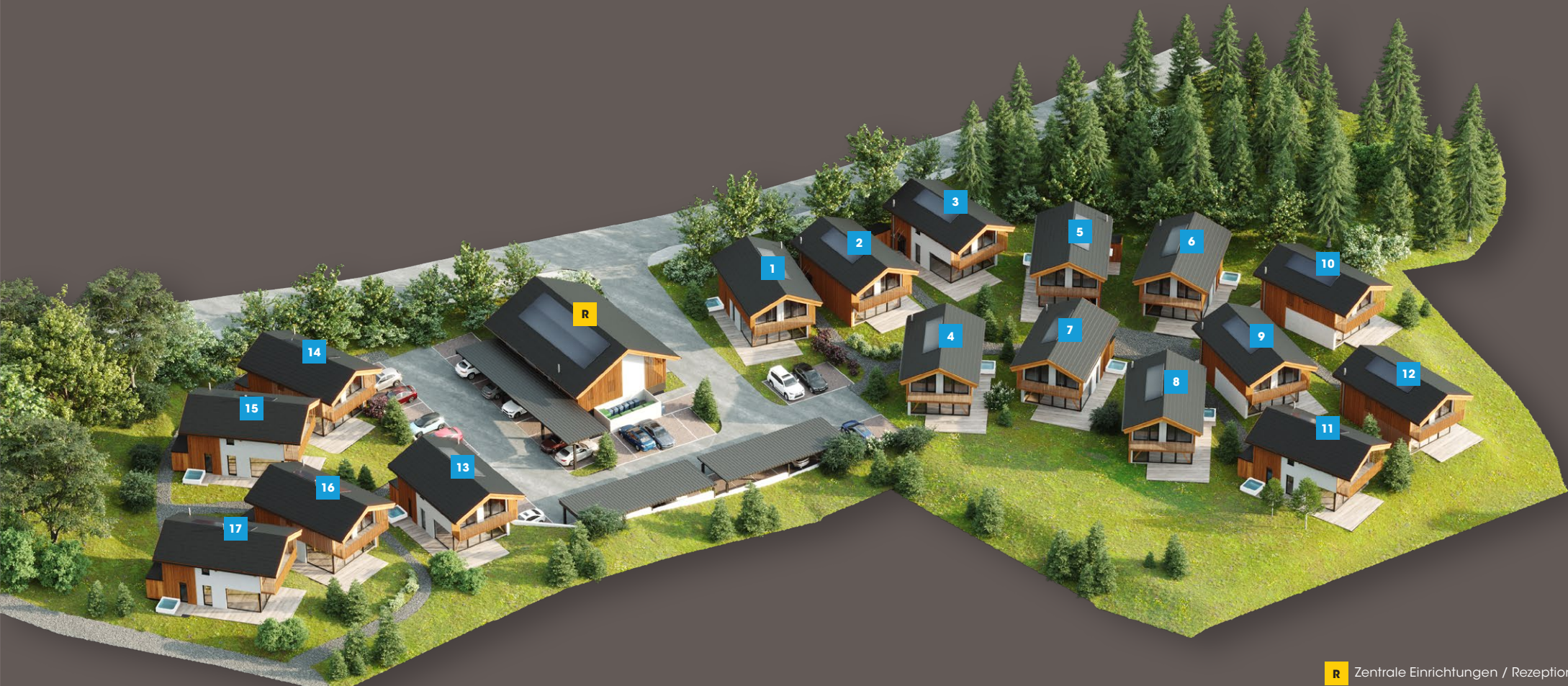
R Zentrale Einrichtungen / Rezeption